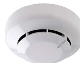
Détecteur de fumée

Veuillez cliquer ici pour toutes les photos d'un fichier zip.