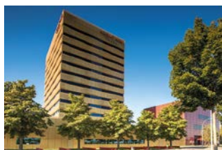
Airport Hôtel Bâlel

Notamment dans les hôtels, la protection contre les incendies comprend certains défis particuliers. Les alarmes intempestives en font partie: «Lorsque l'on fume sur le balcon ou que trop de vapeur passe de la salle de bains dans la chambre d'hôtel, il se peut qu'une fausse alarme soit déclenchée, explique René Häcki, responsable de la succursale de Bâle et responsable produit pour les systèmes de détection d'incendie chez BSW SECURITY. Un système de détection d'incendie intelligent qui peut, par exemple, distinguer de manière fiable la vapeur de la fumée, est d'autant plus important.» Les détecteurs de fumée optiques de BSW réduisent considérablement le risque d'alarmes intempestives et de fausses alarmes et évitent Anisa les évacuations inutiles et les interventions des pompiers pour rien.