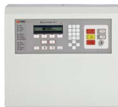
Centrale de détection d'incendie Solution F1